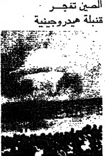
الصين تقدر قنبلة هيدروجينية

وزعت وكالة « هشينوا » الرسمية الصينية على وكالات الاجباء العالمية قبل يومين ، هذه الصورة لآخر تجربة ناجحة اجرتها الصين لتفجير قنبلة هيدروجينية . ويبدو في نهاية الصورة جنود صينيون يرتدون خوذة الحماية او على . ولم تفكر الوكالة اين جرت التجربة او على . ولكن المصادر الغربية اعربت عن اعتقادها بان ذلك تم في ٧ تشرين الاول عام ١٩٧٦ عندما تصام « هوا كيو - فاتح » زعامة الحزب الشيوعي الصيني .